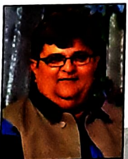
● ભદ્રાચુ વછરાજાની જાણીતા લેખક અને વક્તા

૧૯૭૬થી બાપુની કથાઓ વિદેશમાં થવા લાગી વિદેશની કથાઓમાં આવતા ભાવિકોમાં ભક્તિ કરતા આદર વધુ હોય છે, વિદેશ વસતા યુવાનો બાપુને ધ્યાનથી સાંભળે છે ને બાપુથી પ્રભાવિત પણ છે !